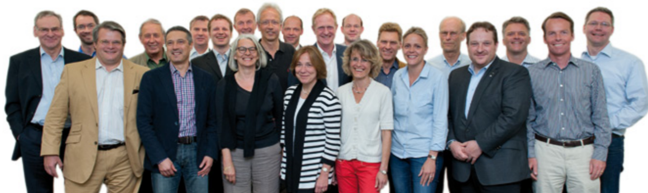
Die 23 Stiferräte von Stifter für Stifter engagieren sich ehrenamtlich für eine Kultur des Stiftens.