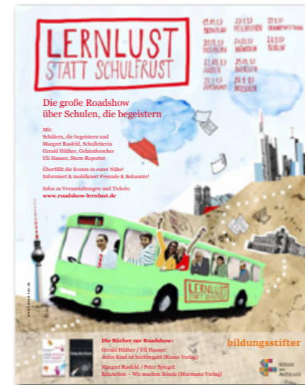
Youth Future Project e.V., Jugendbewegung des Alternativen Nobelpreises