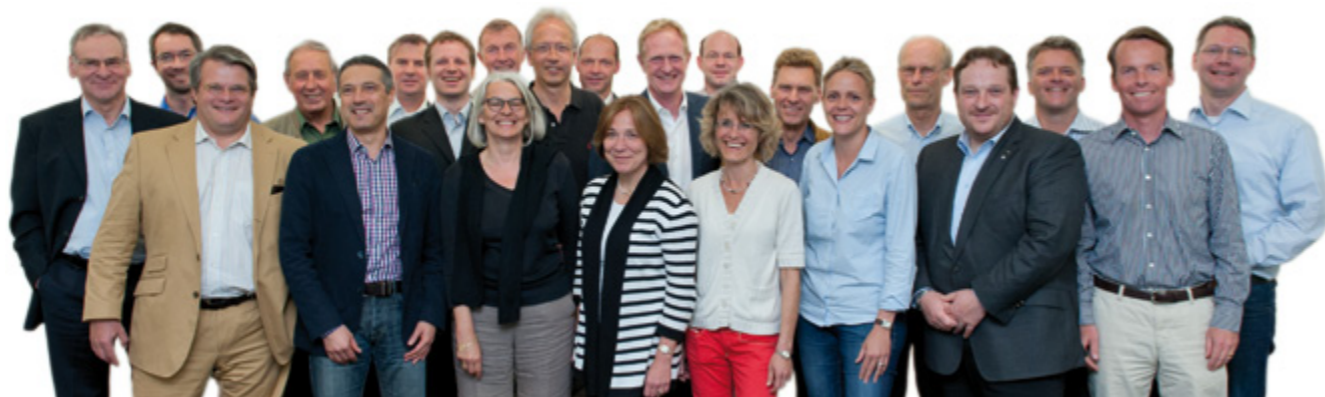
Die 23 Stiferräte von Stifter für Stifter engagieren sich ehrenamtlich für eine Kultur des Stiftens.