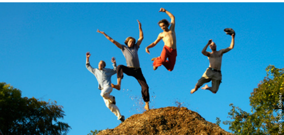
Wir und jetzt: »Wir erleben die Erde als lebendigen Organismus, von dem wir Menschen ein Teil sind.«