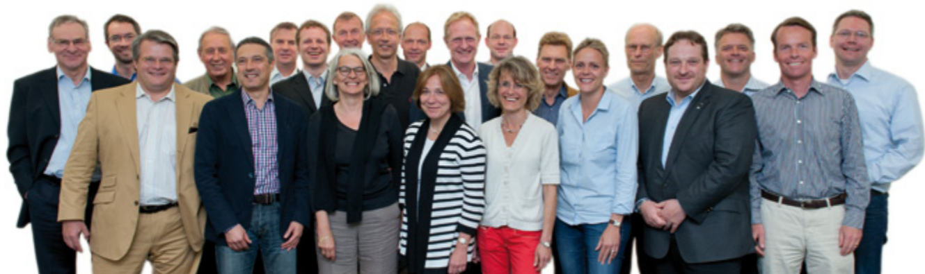
Die 23 Stiferräte von Stifter für Stifter engagieren sich ehrenamtlich für eine Kultur des Stiftens.